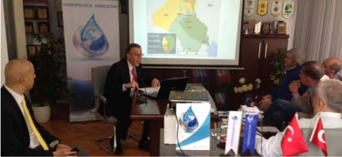
Prof Dr George W. Gawrych "Sykes-Picot dan Günümüze Ortadoğu "konferansında -12 Mayıs 2016-Su Politikaları Derneği –Ankara

Brookings Institution tarafından 2015 yılında yayınlanan "Deconstructing Syria Towards a regionalized strategy for a confederal country" raporunda da Suriye'de amaçlanan siyasal yapının birçok otonom bölgeden oluşan bir konfederasyona olduğu ifade edilmektedir. Bu otonom yapılar arasında IŞİD ve El Nusra'nın bulunmayacağı ve konfederasyonun da bir barış gücüne ihtiyaç duyacağı belirtilmektedir.